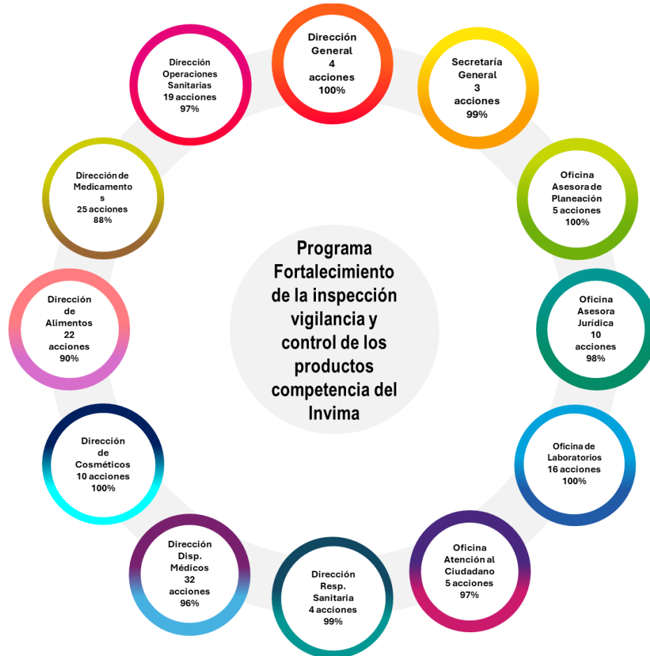
Gráfica 2 Contribución por dependencia al Programa Fortalecimiento de la inspección, vigilancia y control de los productos competencia del Invima