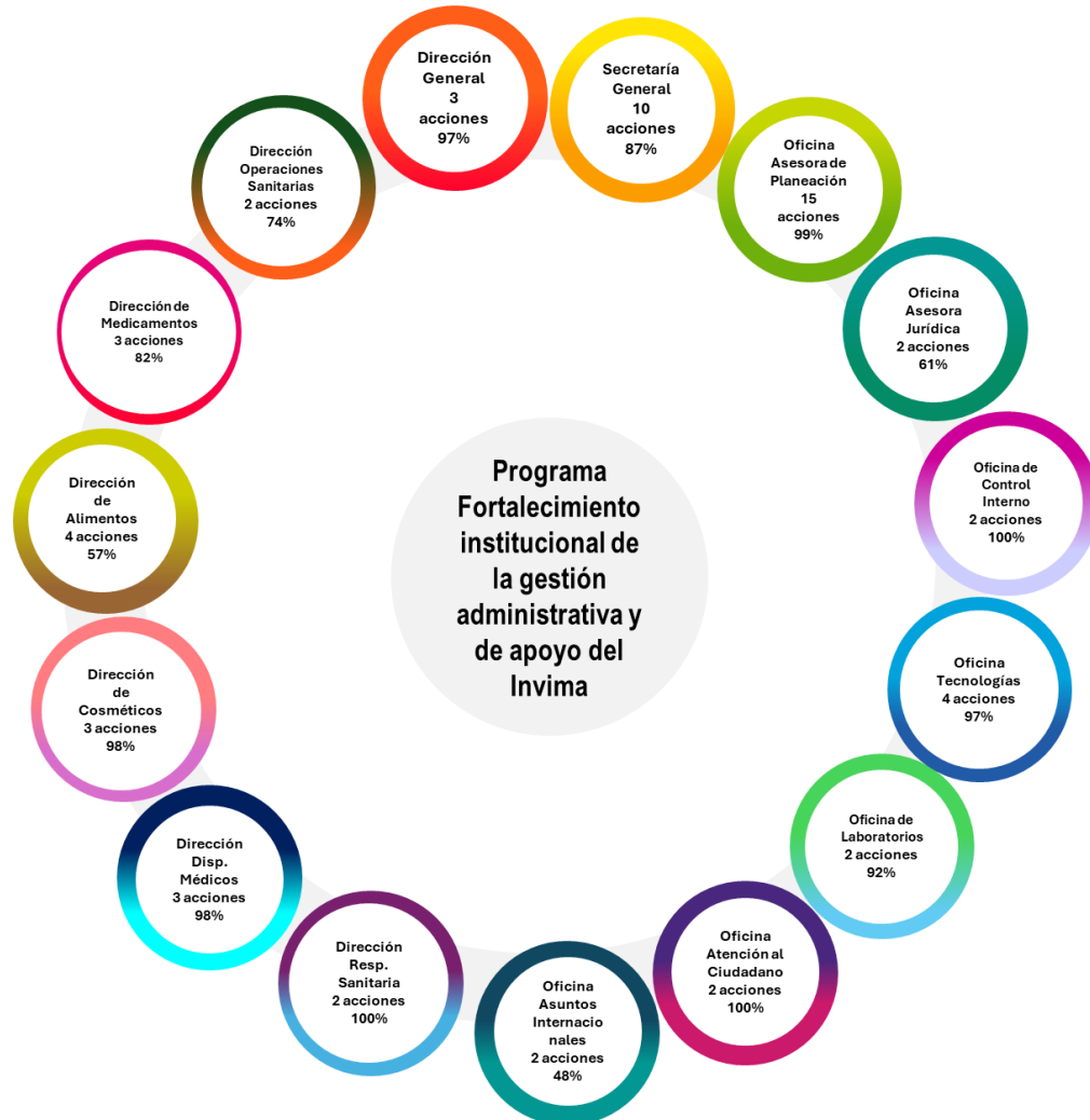
Gráfica 3 Contribución por dependencia al Programa Fortalecimiento Institucional de la gestión administrativa y de apoyo del Invima