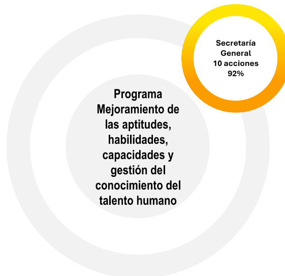
Gráfica 4 Contribución por dependencia al Programa Mejoramiento de las aptitudes, habilidades, capacidades y gestión del conocimiento del talento humano

Fuente: Plan Operativo Anual 2023 – Oficina Asesora de Planeación