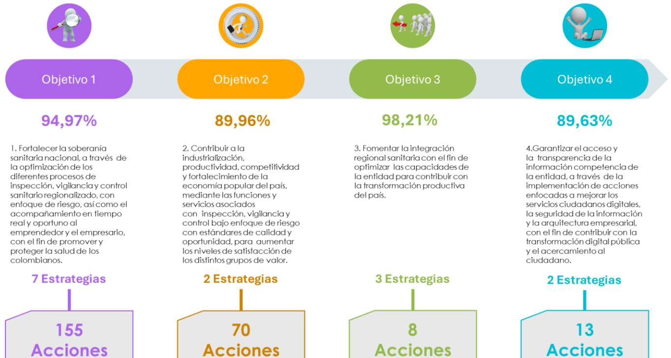
Ilustración 1 Participación de las acciones del POA en el logro de los objetivos estratégicos