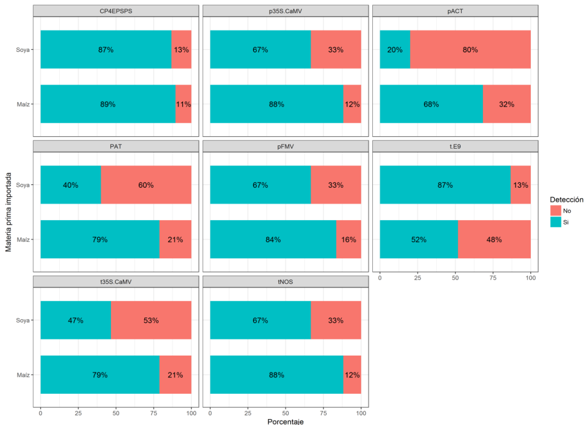
Figura.1 Análisis de detección de trazas de OGM por PCR en tiempo real en maíz y soya.

Si se comparan estos resultados con los obtenidos el año anterior, es posible afirmar que el comportamiento continúa siendo el mismo, un gran porcentaje del maíz que entra al país proviene de Estados Unidos, ya que existen evidencias que en este país se cultivan grandes extensiones de maíz genéticamente modificado (James, Clive. 2015). En el análisis también quedó demostrado que desde Argentina y Países Bajos también ingresa maíz con un 100% de trazas de OGM (Figura 8).