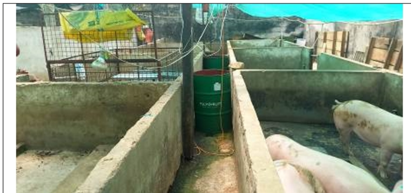
Fotografía N°.1: Panorámica de los corrales área donde se observa porcinios el sitio objeto de visita.

Que conforme a lo establecido en el Informe Técnico DRSC No. 09235003974 de 07 de noviembre de 2023, se pudo evidenciar en el predio denominado Burdeos identificado con cédula catastral No. 25200000000030034 y matrícula No. 176-0011515, en la vereda Rincón Santo del Municipio de Cogua-Cundinamarca, la actividad de porcicultura, donde se observó doce (12) corrales de 10 m 2 aproximadamente, construido en mampostería y piso en concreto, ubicado en las coordenadas E:4893148 N: 2117795 altura de 2689 msnm, en el cual se encontraron 8 cerdos en etapa de cría y ceba, como se observa a continuación: