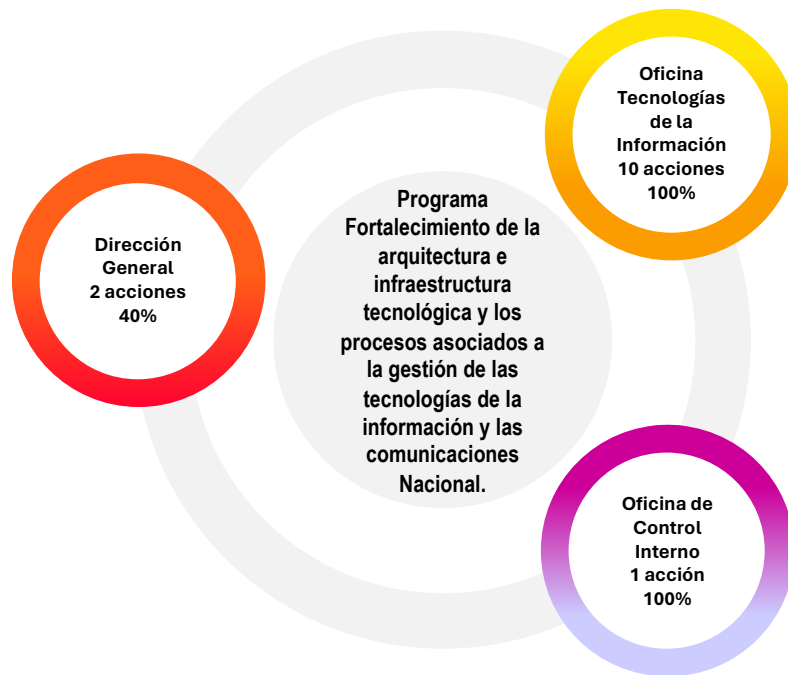
Gráfica 5 Contribución por dependencia al Programa Mejoramiento de las aptitudes, habilidades, capacidades y gestión del conocimiento del talento humano