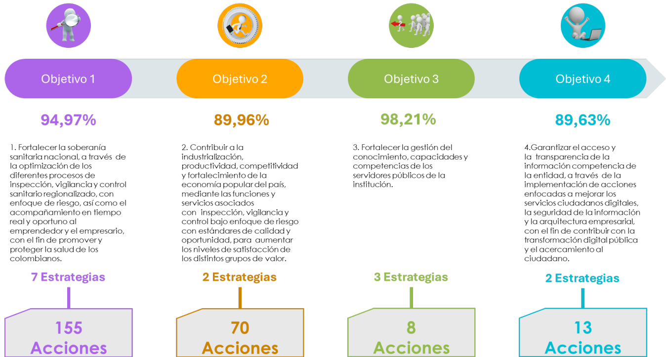
Ilustración 1 Participación de las acciones del POA en el logro de los objetivos estratégicos