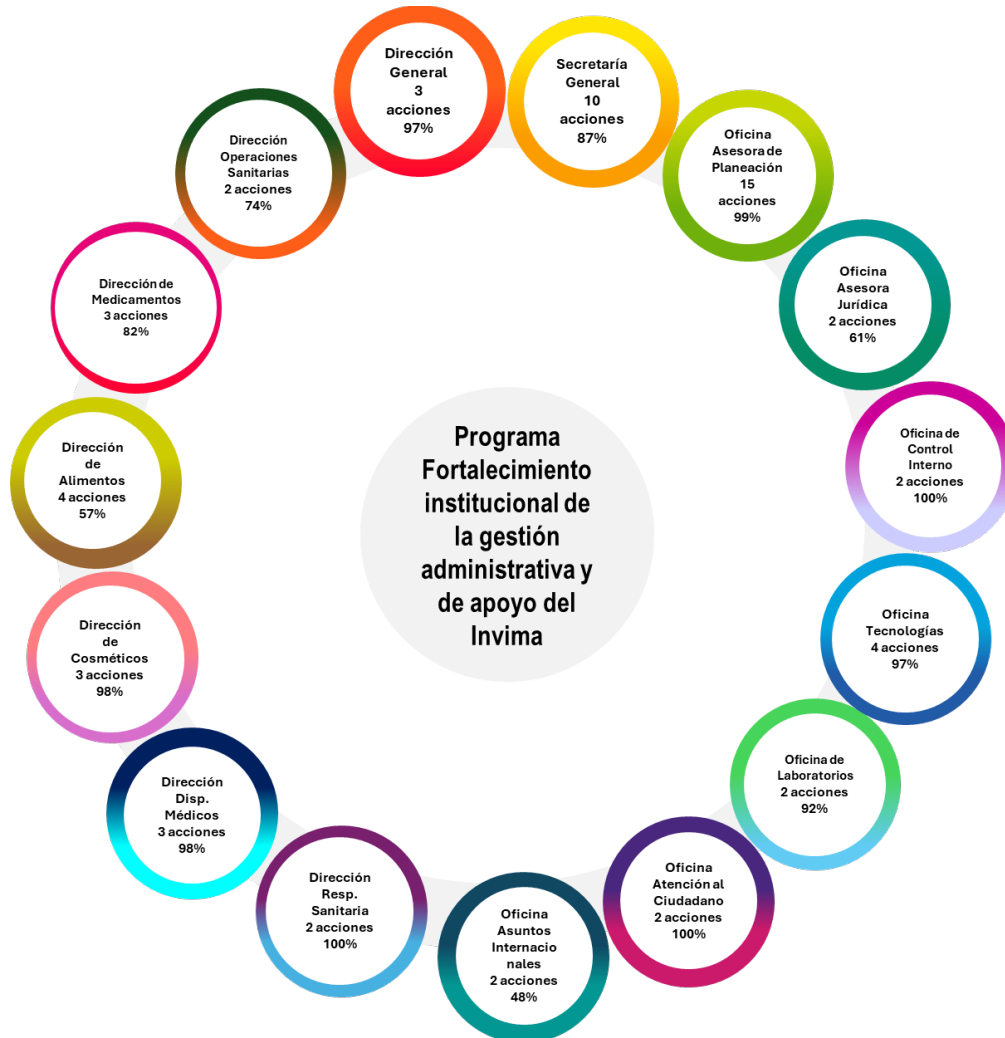
Gráfica 3 Contribución por dependencia al Programa Fortalecimiento Institucional de la gestión administrativa y de apoyo del Invima