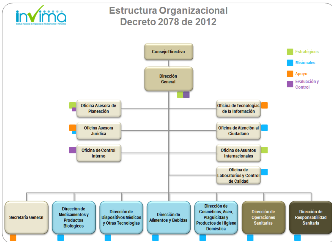
Ilustración No. 1 Estructura Organizacional del Invima

La Oficina de Control Interno está definida en la Ley 87 de 1993, como uno de los componentes del Sistema de Control Interno, del nivel directivo, encargada de medir la eficiencia, eficacia y economía de los demás controles, asesorando a la Alta Dirección en la continuidad del proceso administrativo, la evaluación de los planes establecidos y en la introducción de los correctivos necesarios para el cumplimiento de las metas u objetivos previstos. En consecuencia, la Oficina de Control Interno hace parte de la estructura organizacional de Instituto Nacional de Vigilancia de Medicamentos y Alimentos Invima , dentro del nivel directivo y es la instancia encargada de evaluar integralmente el desempeño del SGI del Instituto, a través de la planificación y realización de Auditorías Internas y de los demás mecanismos de evaluación previstos en las caracterizaciones del Macroproceso de Gestión de Seguimiento y Control y de los Procesos de Auditoría Interna y Seguimiento a la Gestión Institucional. Ver Ilustración No. 1 - Estructura Organizacional del Invima .