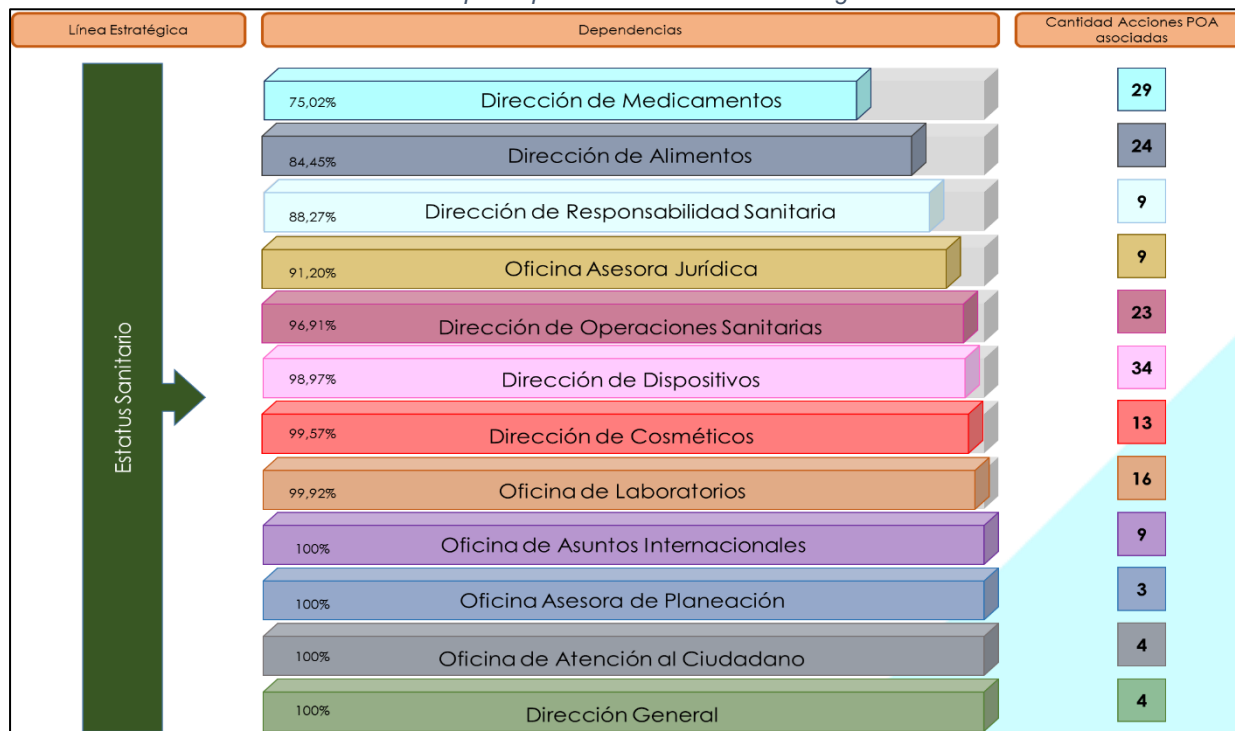
Gráfica 2 Contribución por dependencia a la Línea estratégica Estatus Sanitario

A continuación se relaciona la contribución de cada dependencia ejecutora con relación a las acciones institucionales que hacen parte de esta línea estratégica.