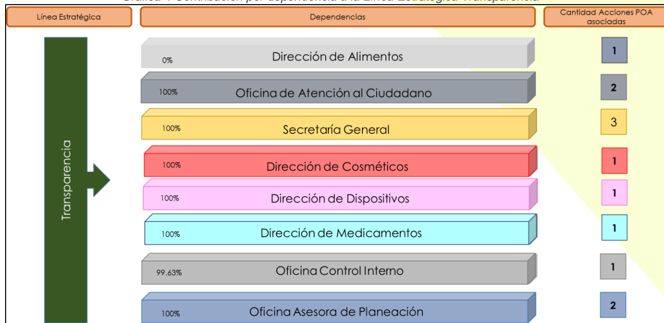
Gráfica 4 Contribución por dependencia a la Línea Estratégica Transparencia

que mitiguen los efectos de la ilegalidad y la corrupción”, en ésta se encuentran el 5% de los indicadores formulados para la vigencia 2020. Está conformada por 12 indicadores que en promedio presentaron una ejecución del 91.64%, como se presenta a continuación: