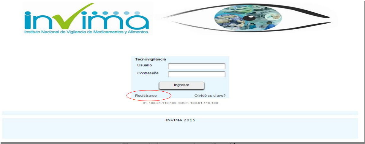
Figura 1. Ingreso a la aplicación