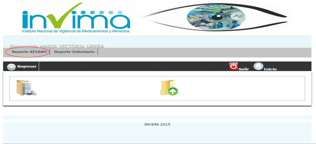
Figura 2. Selección del formulario