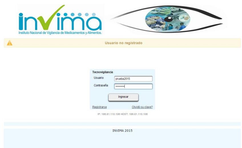
Figura 3. Error de ingreso