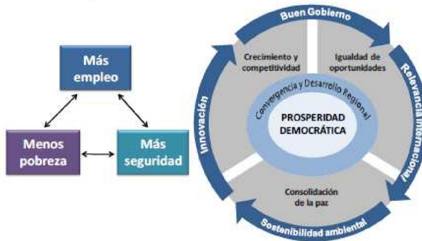
Figura 1: Pilares del Plan Nacional de Desarrollo 2010-2014